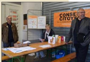
■ Les membres du conseil ont distribué renseignements et flyers.

PRATIQUE Prochaine animation, le 22 juin de 9 à 11 heures. E-mail : ccc42500@gmail.com